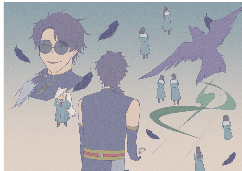
烏澄 影翔、紅葉 狐々