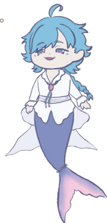
キャラクターラフ→

また、キラキラしたものを集めるのが趣味で、いくつもの宝箱を持っている。自分のものに対しての執着心が強く、一度手に入れたら二度と手放すことはない。