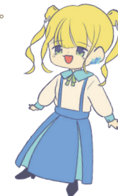
キャラクターラフ

アイドルグループ『Nautis』に属している「ネモ」を推している。ライブに参加した時は近くの人に声をかけ写真を撮ってもらい、隣席の人に即座に話しかけ仲良くなるタイプの行動力のあるオタク。