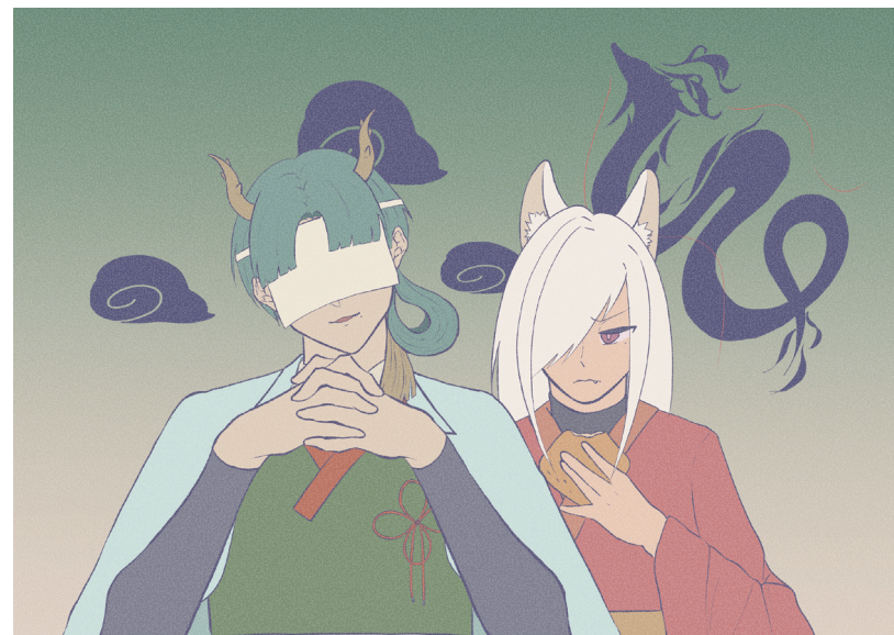
天智 蒼凜、紅葉 狐々